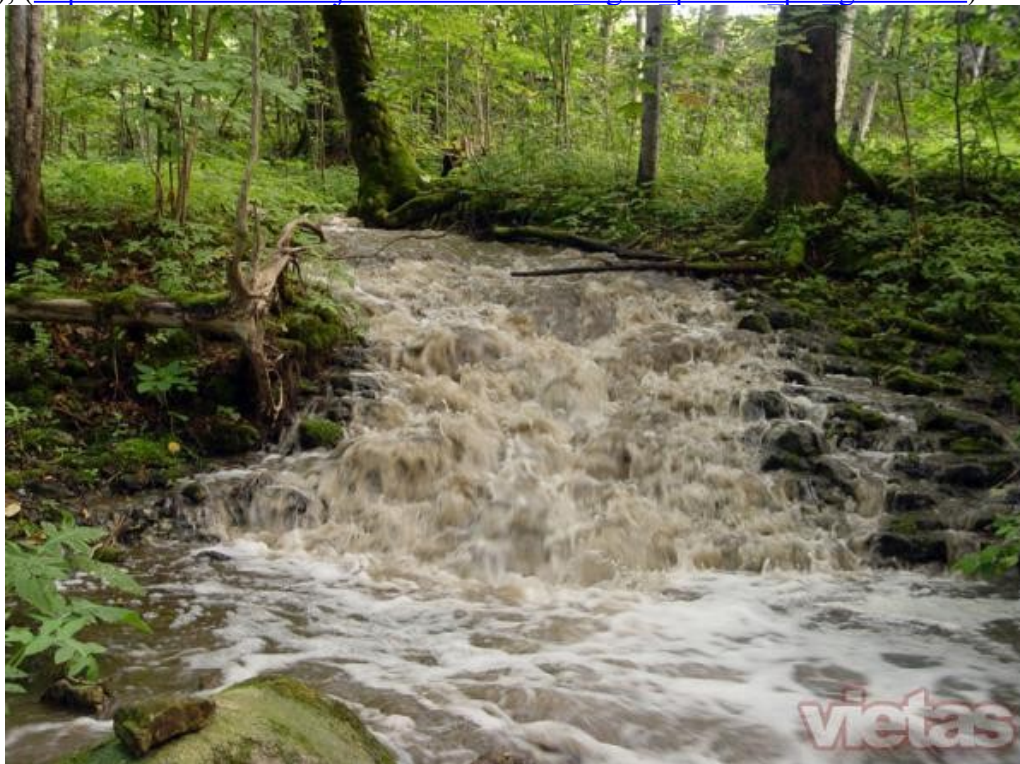
3.3.1. attēls. Glāžšķūņa Garais ūdenskritums

Ogres upe ir iecienīts ūdenstūristu maršruts. Tās krastos atsedzas dolomītu atsegumi („Kalnrēžu atsegums”), kā arī ir labvēlīgi nosacījumi nelielu ūdenskritumu izveidošanai - novada teritorijā atrodas 3 nelieli ūdenskritumi. Neliels ūdenskritums ar trim kaskādēm atrodas nelielā Ogres labā krasta pietekā ap 300 m lejpus Ķeguma - Suntažu ceļa tilta, platums 1-2 metri. Nākamais ūdenskritums atrodas Ogres labā krasta pietekā pie Skujnieku mājām, kas ir netālu no Glāžšķūņa, ap 1 km augšpus Ķeguma - Suntažu ceļa tiltam, platums ap 0,6 metri, augstums ap 0,9 metri. Vēl viens ūdenskritums atrodas augšpus Glāžšķūņa tiltam, platums ap 0,6 metri, augstums ap 0,9 metri (skat. 3.3.1. att.), ( http://www.vietas.lv/objekts/udenskritumi_ogres_pieteka_pie_glazskuna ).