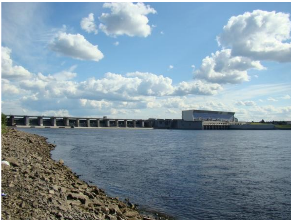
3.3.2. attēls. Ķeguma HES