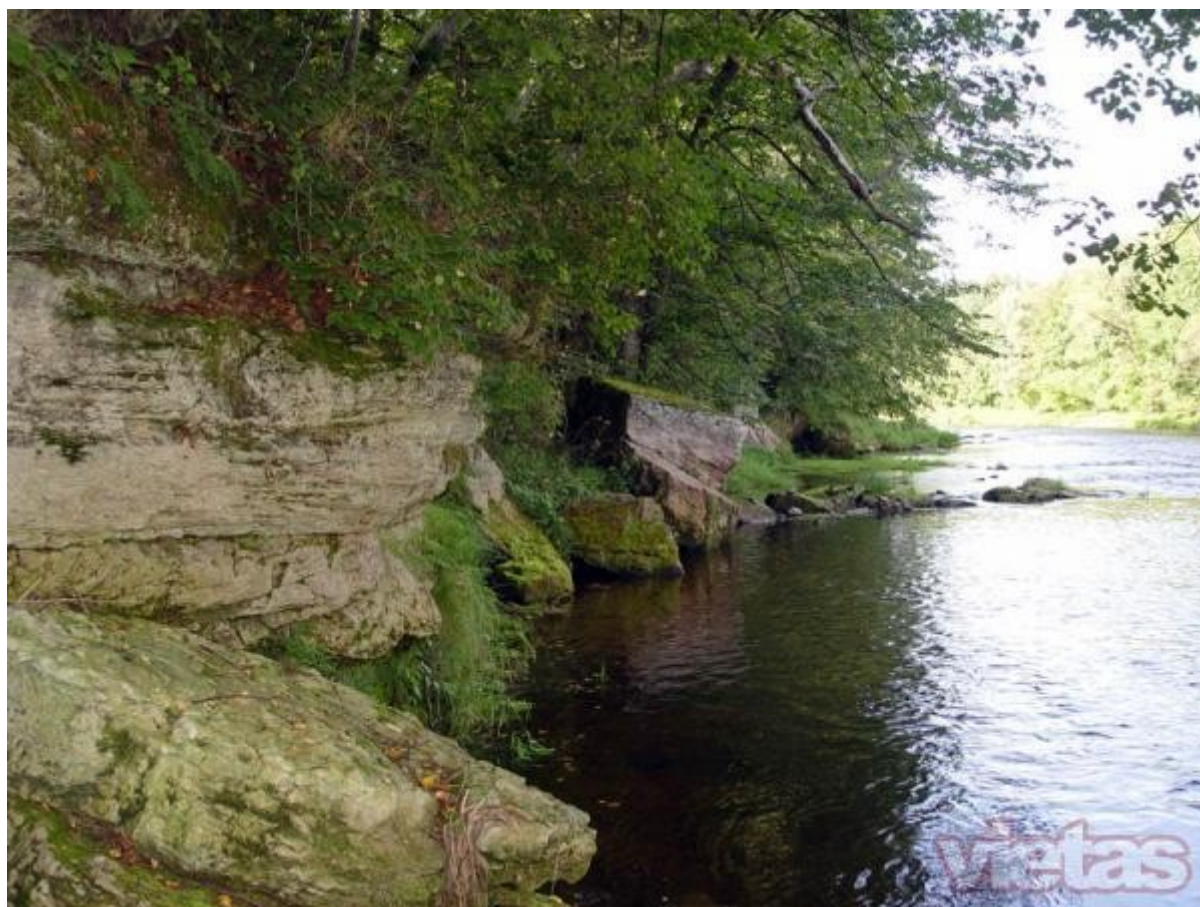
4.3.1. attēls. Kalnrēžu dolomītsmilšakmens atsegums